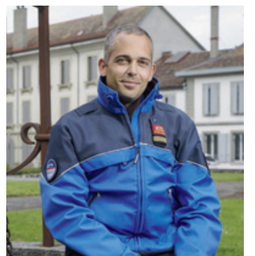
Martin de Mural dirigera Police Région Morges jusqu'au 31 août.

Est-ce que votre décision est due à la remise en question de la PRM par certaines communes, à l'image de Tolochenaz dont cer-